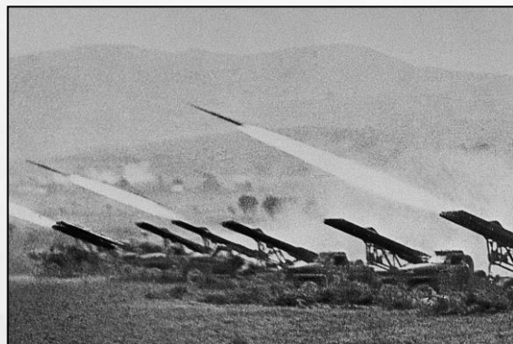
Залп дивизиона БМ-13. 1942 год

НА БАЗЕ ЦММ БЫЛ ВЫДЕЛЕН ЦЕХ №2 ДЛЯ ВЫПУСКА ВОЕННОЙ ПРОДУКЦИИ – БОЕГОЛОВОК К ЛЕГЕНДАРНЫМ «КАТЮШАМ» (БМ – 13).