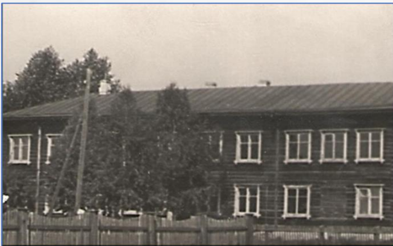
ЗДАНИЕ В ПОС. ИС, ГДЕ РАСПОЛАГАЛСЯ ГОСПИТАЛЬ

НЕИЗБЕЖНЫЙ АТРИБУТ ВОЙНЫ – ЭВАКОГОСПИТАЛЬ. В ГОДЫ ВЕЛИКОЙ ОТЕЧЕСТВЕННОЙ ВОЙНЫ В ИСОВСКОМ РАЙОНЕ В НОЯБРЕ 1941 – ЯНВАРЕ 1942 ГОДА В ПОСЁЛКЕ ИС БЫЛ РАЗБИТ ГОСПИТАЛЬ НА 400 КОЕК №1799/3856 НАРКОМАТА ЗДРАВООХРАНЕНИЯ.