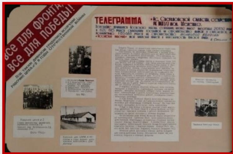
Стенд в школьном музее

В АПРЕЛЕ 1943 ГОДА ТЕЛЕГРАФ ПРИНЁС РАДОСТНУЮ ВЕСТЬ: «ИС СВЕРДЛОВСКОЙ ОБЛАСТИ, СЕКРЕТАРЮ РК ВКП(Б) Т. МЕЛЕШКО. ПЕРЕДАЙТЕ ТРУДЯЩИМСЯ ИСОВСКОГО РАЙОНА ЗА СОБРАННЫЕ КРОМЕ РАНЕЕ ВНЕСЁННЫХ 2 128 512 РУБЛЕЙ И 620 615 РУБЛЕЙ ОБЛИГАЦИЙ ГОСУДАРСТВЕННЫХ ЗАЙМОВ НА СТРОИТЕЛЬСТВО ТАНКОВ И САМОЛЁТОВ, ДОПОЛНИТЕЛЬНО 1 155 688 РУБЛЕЙ НА СТРОИТЕЛЬСТВО ТАНКОВОЙ КОЛОННЫ «ИСОВСКИЙ РАБОЧИЙ» МОЙ БРАТСКИЙ ПРИВЕТ И БЛАГОДАРНОСТЬ КРАСНОЙ АРМИИ». И. СТАЛИН»