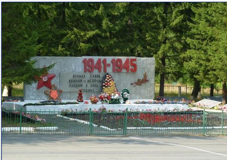
МЕМОРИАЛ, ПОСВЯЩЁННЫЙ ВОИНАМ-ИСОВЧАНАМ, ПАВШИМ В БОЯХ ЗА РОДИНУ

РУДОВЫЕ ПОДВИГИ ИСОВЧАН В ГОДЫ ВЕЛИКОЙ ОТЕЧЕСТВЕННОЙ ВОЙНЫ НАВСЕГДА ВПИСАНЫ В ИСТОРИЮ СТРАНЫ.