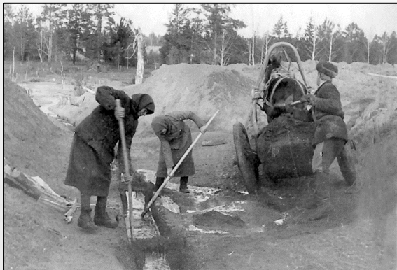
Семейная работа старателей 1943 г.

С ПЕРВЫХ ДНЕЙ ВОЙНЫ НА ПРИСКЕ ВОЗРОЖДАЕТСЯ АРТЕЛЬНЫЙ ПРОМЫСЕЛ – СОЗДАЮТСЯ НОВЫЕ АРТЕЛИ ИЗ СТАРИКОВ, ЖЕНЩИН И ПОДРОСТКОВ. ВСЕ ЭТО ПОЗВОЛИЛО В ЧЕТЫРЕ РАЗА УВЕЛИЧИТЬ СТАРАТЕЛЬСКУЮ ДОБЫЧУ МЕТАЛЛА.