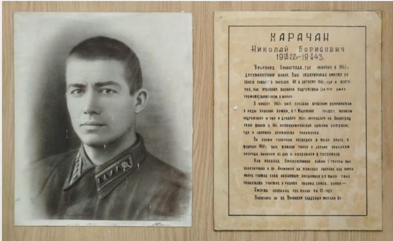
СТЕНД В ШКОЛЬНОМ МУЗЕЕ

В ФОНДЕ Р-5 «ВОЕННЫЙ КОМИССАРИАТ СВЕРДЛОВСКОЙ ОБЛАСТИ УРАЛЬСКОГО ВОЕННОГО ОКРУГА» ИМЕЮТСЯ СВЕДЕНИЯ О ЗАХОРОНЕНИЯХ УМЕРШИХ ОТ РАН И БОЛЕЗНЕЙ ВОЕННОСЛУЖАЩИХ КРАСНОЙ АРМИИ, НАХОДИВШИХСЯ НА ИЗЛЕЧЕНИИ В ГОСПИТАЛЯХ СВЕРДЛОВСКОЙ ОБЛАСТИ.