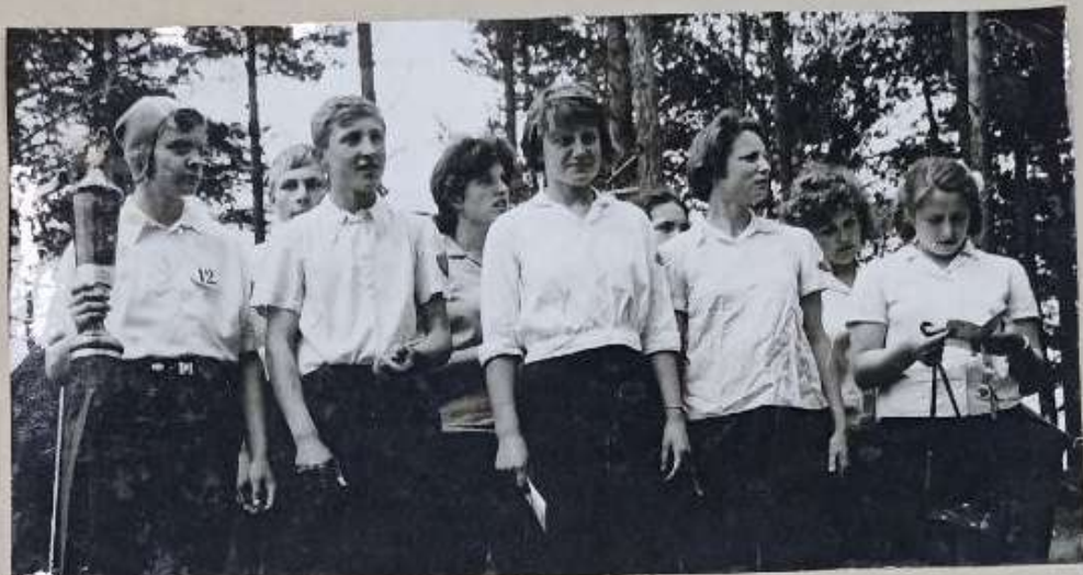
9# КРАТНЫЕ ПОБЕДИТЕЛИ - ИСОВЧАНИЕ

1963-1964гг. Путешествия прово- дилось в 2 этапа. 1 этап, Год 7-летки шестой (заочные путешествия) 2 этап - походы, По дорогам славных дел семилетки "3 сильнейших от- ряда получили право участвовать на областной слет-конференции Отряд победитель 9городского слета прямо из похода прибыл на XIX областной слет.