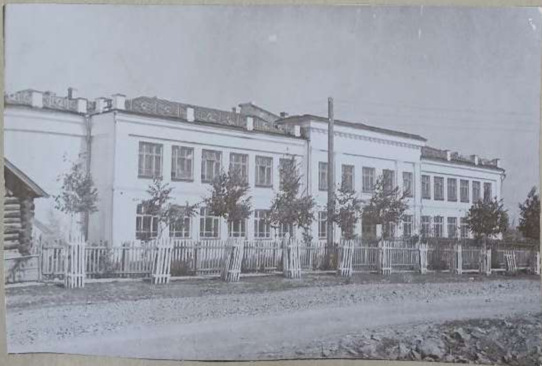
Исковская школа - зачинатель туризма

На XI областном турслете они завоевали 5 е место.