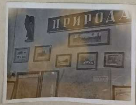
↑ ОТДЕЛ ПРИРОДЫ