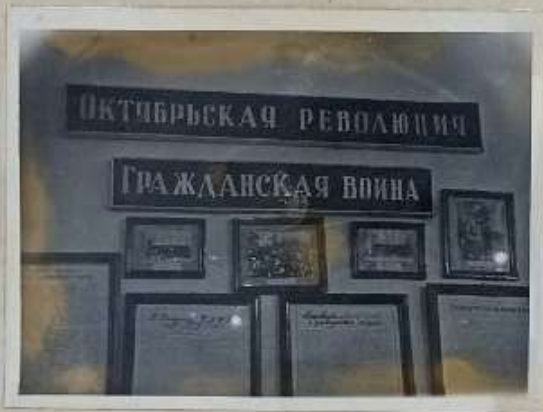
↑ ИСТОРИЧЕСКИЙ ОТДЕЛ