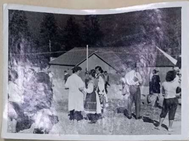
СЛЕТ В ЗАКАРПАТЬЕ