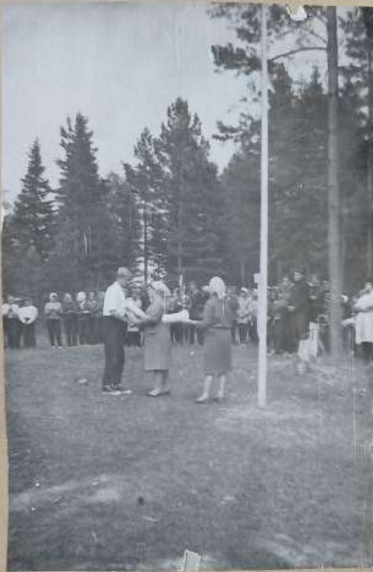
НАГРАДЫ - ЛУЧШИМ