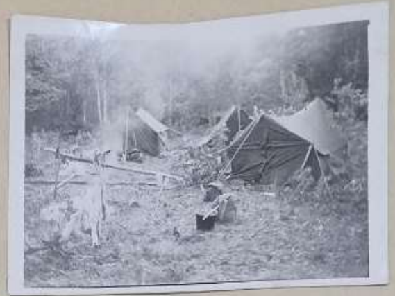
СЛЕТ В КУЗБАССЕ