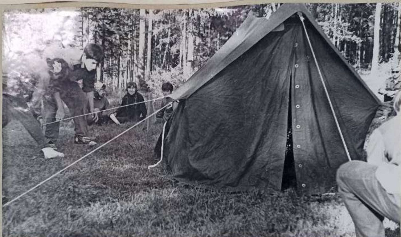
↑ УСТАНОВКА ПАЛАТКИ

ПIONEРИЯ НА СТАРТЕ НИА ЛЕНИНА НА КАРТЕ К КОММУНИЗМУ-ПУТЬ ОТКРЫТ МАЯКОМ ДЛЯ НАС ГОРИТ.