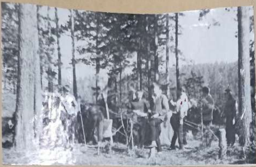
ТУРИСТСКИЕ „БУДНИ“ → ↗