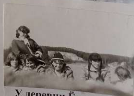
У деревни Ёлкино