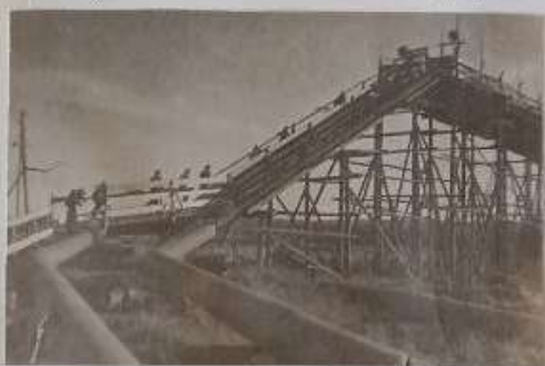
Промысла. Гидравлика №13. Шлюзы