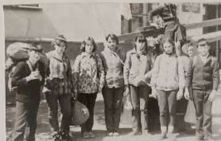
Участник похода 1983 г.