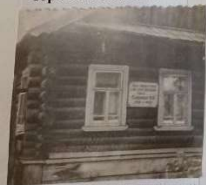
Дом, где родился Герой Советского Союза Скорынин В.П.