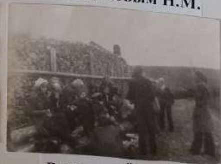
В деревне Ёлкино