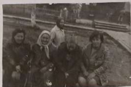
Беседа с начальником станции Платина