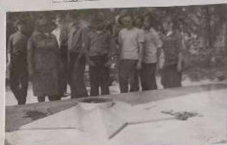
По г. Красноуральску