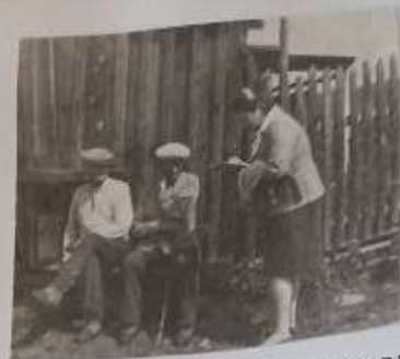
Встреча в посёлке Троицком с участниками Великой Отечественной войны: