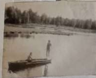
на реке Вья