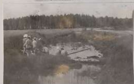
На пути к Ясьве