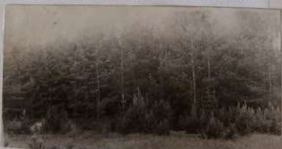
Дорога от Иса к Троицкому