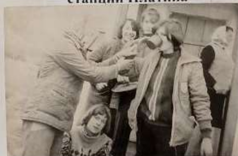
Утолили жажду после похода