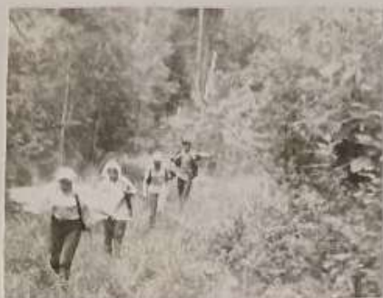
От Красноуральска в Ясьве