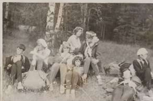
Отдых после большого перехода