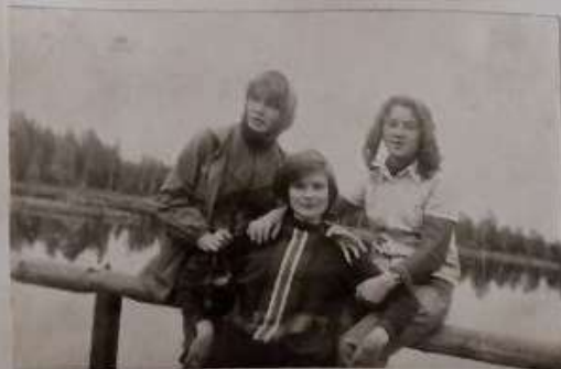
Отдых на берегу реки Туры