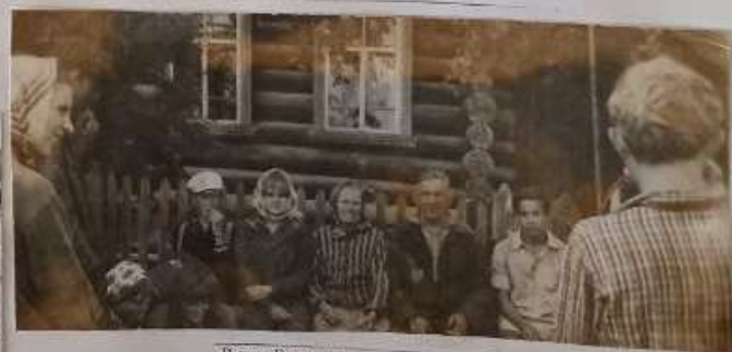
В селе Балакино