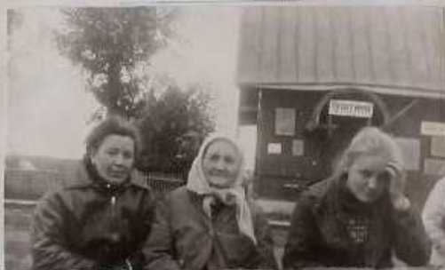
На станции Платина