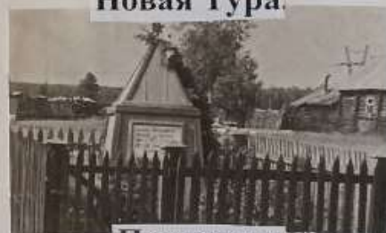
Памятник комиссару Бессонову