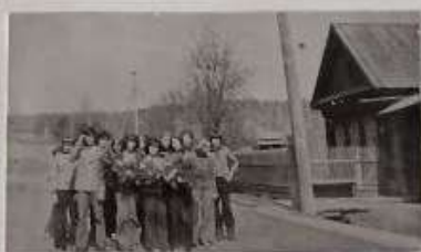
Гирлянда для БРАТСКОЙ МОГИЛЫ