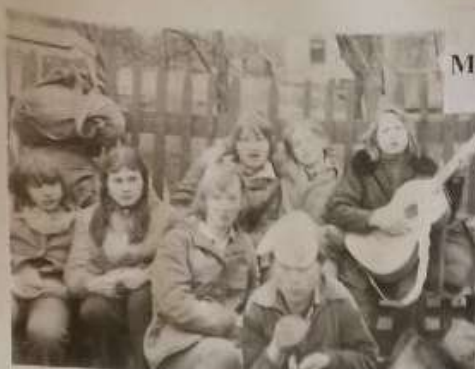
Участники похода 1981 г.