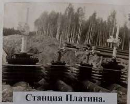
Станция Платина. Строится нефтеперекачивающая станция