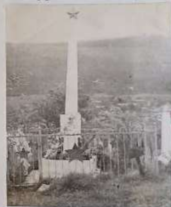
Памятник на братской могиле в пос.Косья