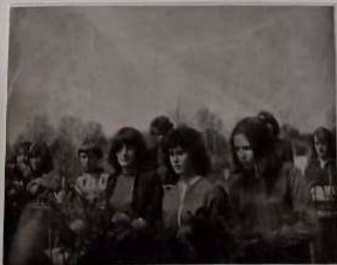
У БРАТСКОЙ МОГИЛЫ