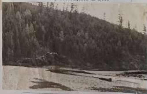
Река Тура около деревни Ванюшино