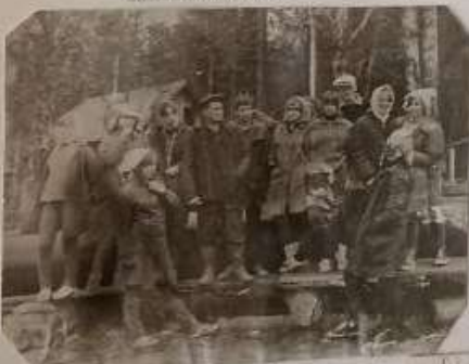
С рабочим гидравлики № 13